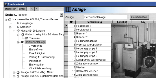
Kundendienst mit flexibler Baumstruktur, Verknüpfungen zu Dokumenten und Bildern

sykasoft. Software - Service - Innovation