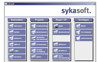
Das neue Programmdesign kann individuell gestaltet werden.

sykasoft. Software – Service – Innovation